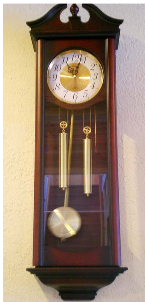
部屋の真ん中にある大きな掛時計が、ゆったりと時を刻んでいます。