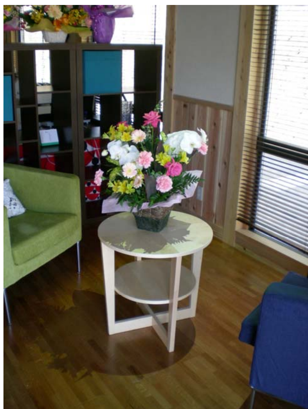
「ひまわり」の光が、コーヒーテーブルをほのかに照らします。

今後とも、皆様方のお力添えを賜りたく、引き続き、ご支援、ご協力のほど、お願い申し上げます。